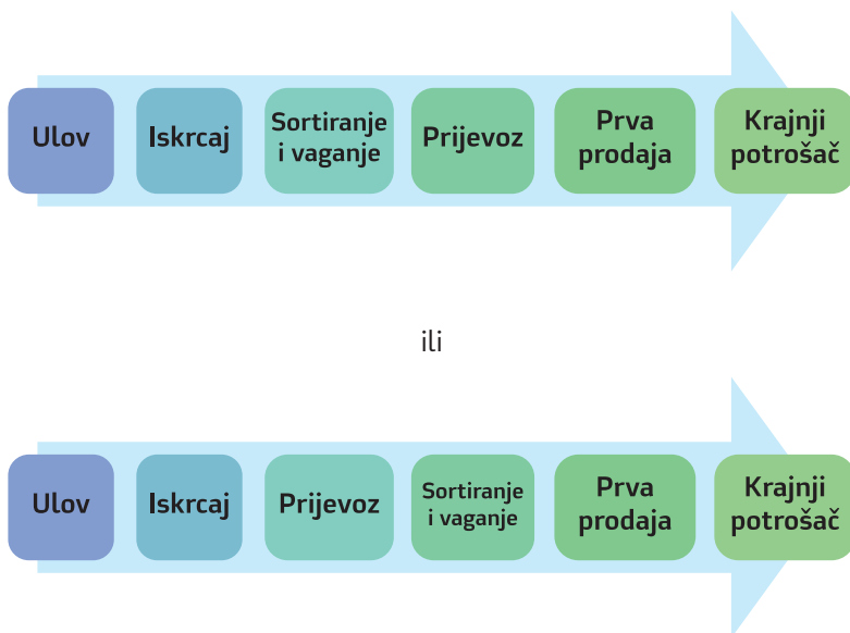
Slika 2. Sljedivost od ulova do krajnjeg potrošača

Samo sortirani proizvodi ribarstva po vrstama i izvaganje se mogu stavljati na tržište. Sljedivost proizvoda ribarstva od ulova do krajnjeg potrošača osigurava se ispunjavanjem i dostavom podataka u propisanoj dokumentaciji, od podataka o ulovljenim količinama koji se nose u očevidnik odnosno izvješće o ulovu, preko dostavljene evidencije o izvaganim količinama po vrstama, transportnog dokumenta te prodajnog lista koji prate proizvode ribarstva do krajnjeg potrošača.