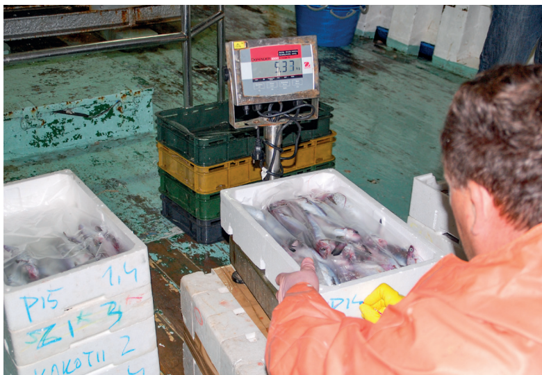
Slika 3. Izvagani i označeni proizvodi

Za ulove namijenjene prvoj prodaji poznatom prvom kupcu izvan teritorija Republike Hrvatske vaganje je obvezno na iskrcajnom mjestu , a inozemni prvi kupac obvezan je na PGR-u podnijeti Zahtjev za odobrenje vaganja na iskrcajnom mjestu, dok iznimno, u slučaju kada inozemni prvi kupac nije poznat i nije moguće vaganje obavljati na plovilu, ribar treba obaviti vaganje te podatke unijeti u transportni dokument na PGR-u.